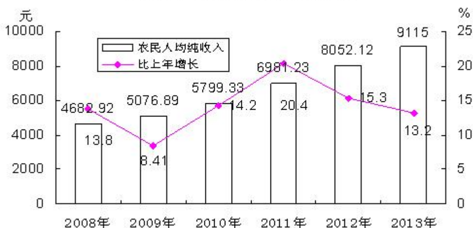
图5 农民人均纯收入及其增长速度

城乡居民收入稳步增长。全年农民人均纯收入 9115 元，比上年增长 13.2%；城镇居民人均可支配收入 20871 元，增长 10.5%。农村居民恩格尔系数 41.37%，城镇居民恩格尔系数 39.2%，比上年分别下降 1.77 个和 1.36 个百分点。年末农村居民人均住房使用面积 51.98 平方米，比上年减少 5.37 平方米；城镇居民人均住房建筑面积 46.51 平方米，比上年增加 10.05 平方米。