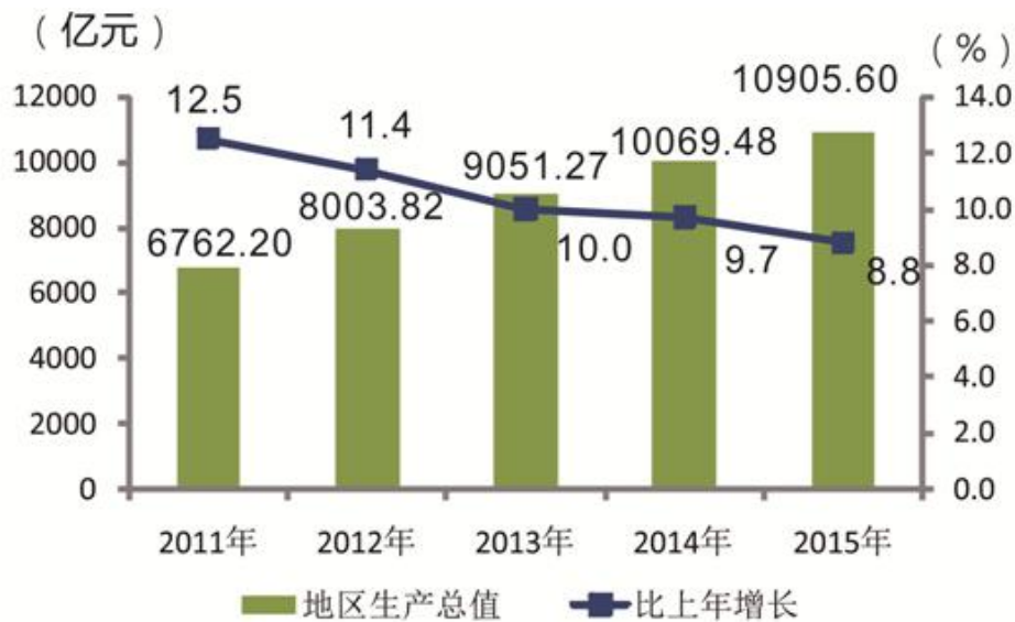
图 1：2011-2015 年地区生产总值及增长速度

“十二五”时期，全市地区生产总值累计 44792.37 亿元，是“十一五”时期的 2.2 倍；年均增长 10.4%，低于“十一五”时期平均增速 4.3 个百分点，其中第一产业、第二产业和第三产业年均分别增长 4.6%、11.6%和 9.8%。三次产业结构由上年的 3.5:47.5: 49.0 调整为 3.3:45.7: 51.0。第三产业占比提高 2 个百分点。