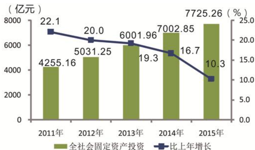
图 5：2011-2015 年全社会固定资产投资及增长速度

“十二五”时期，全社会固定资产投资累计 30016.48 亿元，是“十一五”时期的 2.5 倍；年均增长 16.1%，低“十一五”时期平均增速 12.9 个百分点。其中，工业投资年均增长 31.5%，高“十一五”时期 6.7 个百分点。