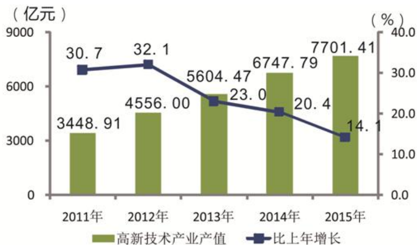
图 8：2011-2015 年高新技术产业产值及增长速度

“十二五”时期，专利申请量与授权量累计分别达到 13.31 万件和 7.93 万件，分别比“十一五”时期增长 2.3 倍和 2.8 倍。高新技术产业产值年均增长 25.6%，低于“十一五”时期平均增速 1.6 个百分点。