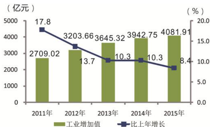
图 4：2011-2015 年工业增加值及增长速度

年末具有资质等级的总承包和专业承包建筑业企业 1232 户。建筑业增加值 906.98 亿元，比上年增长 7.1%。建筑业总产值 6016.26 亿元，增长 3.0%。