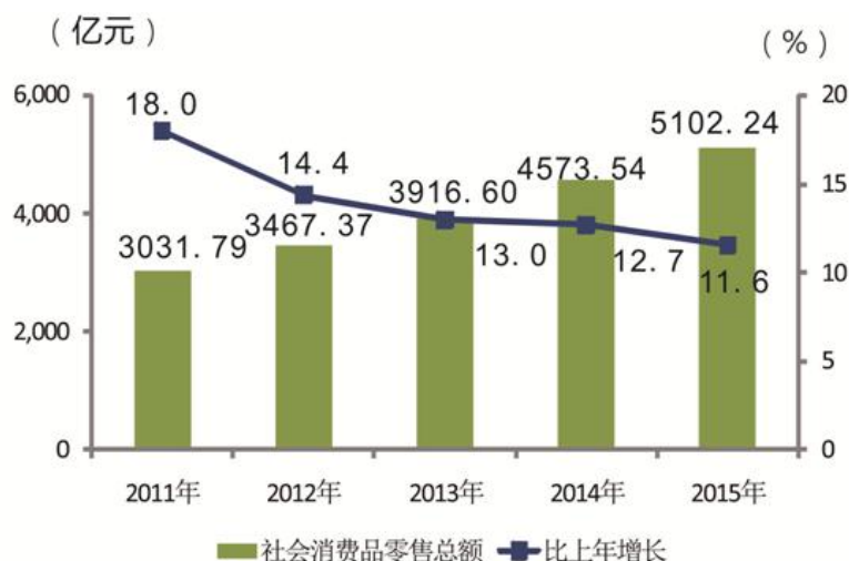
图 6：2011-2015 年社会消费品零售总额及增长速度

全年接待国内旅游者 21032.98 万人次，比上年增长 10.0%；接待海外旅游者 202.27 万人次，增长 18.6%。实现旅游总收入 2188.97 亿元，增长 12.3%。其中，国内旅游收入 2115.23 亿元，增长 11.8%；国际旅游收入 12 亿美元，增长 28.5%。年末旅游景区 36 个，其中 5A 级 3 个，4A 级 15 个，3A 级 17 个。旅游星级以上宾馆 81 家，其中五星级 14 家，四星级 29 家，三星级 29 家。