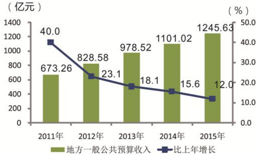
图 2：2011-2015 年地方一般公共预算收入及增长速度