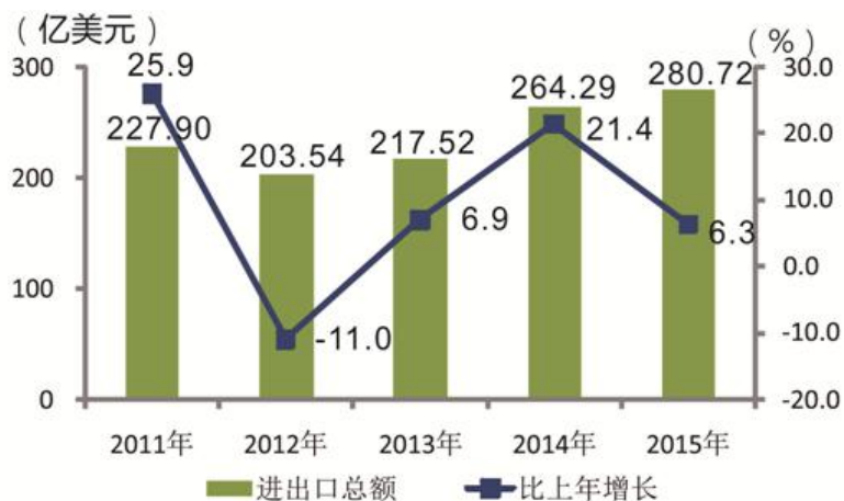
图 7：2011-2015 年进出口总额及增长速度