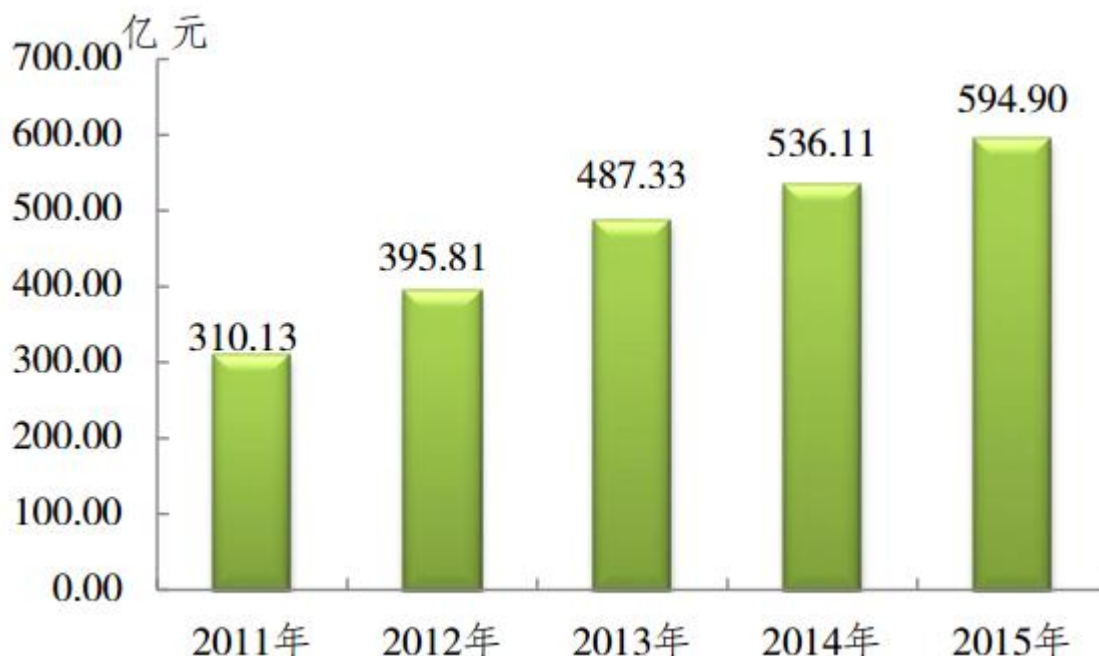
图 3 2011—2015 年全区固定资产投资总额

全年，完成全社会固定资产投资总额 594.90 亿元，同比增长 11.0%。其中在建重点项目 101 个，完成投资 482.09 亿元，占全社会固定资产投资的 81.0%。分产业看，第一产业投资 6.74 亿元，同比下降 32.2%；第二产业 226.36 亿元，同比增长 18.9%，其中工业投资 226.36 亿元，同比增长 18.9%，占全社会固定资产投资的比重 38.1%；第三产业 361.80 亿元，同比增长 7.8%，其中房地产开发投资 232.37 亿元，同比增长 6.8%，占全社会固定资产投资的比重 39.1%。