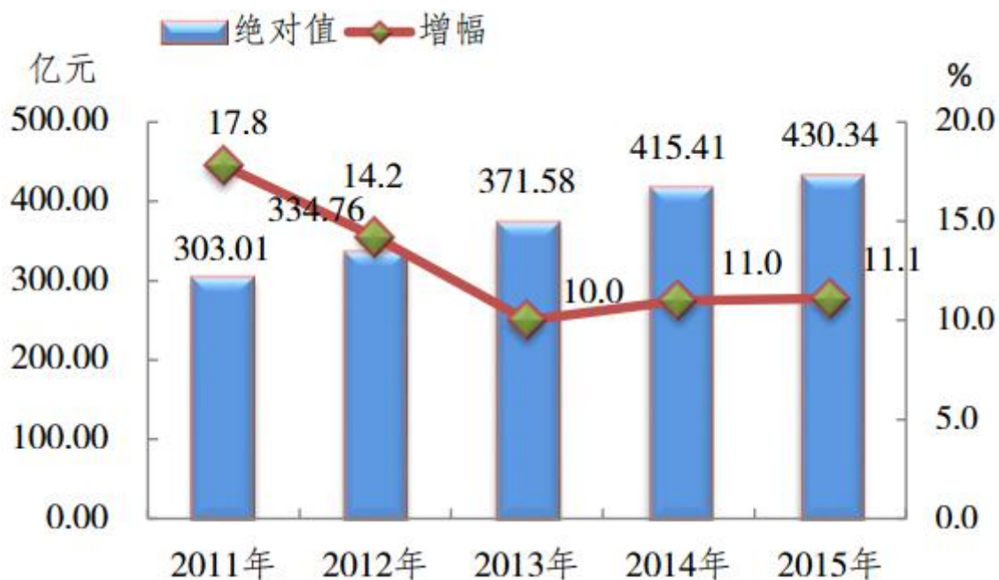
图1 2011—2015年全区生产总值及其增幅

初步核算，2015年全区实现生产总值[2]430.34亿元，占全市GDP比重2.7%。按可比价格计算，GDP同比增长11.1%，排名主城第5位。第一产业增加值14.57亿元，增长3.1%；第二产业增加值280.72亿元，增长12.0%，其中工业增加值229.90亿元，增长12.0%；第三产业增加值135.05亿元，增长10.0%。三次产业结构比例为3.4:65.2:31.4。三次产业对经济增长的贡献率分别为0.8%、72.0%、27.2%，分别拉动全区经济-2-济增长0.1、8.0、3.0个百分点。按常住人口计算，2015年全区人均生产总值达55275元，同比增长9.3%。