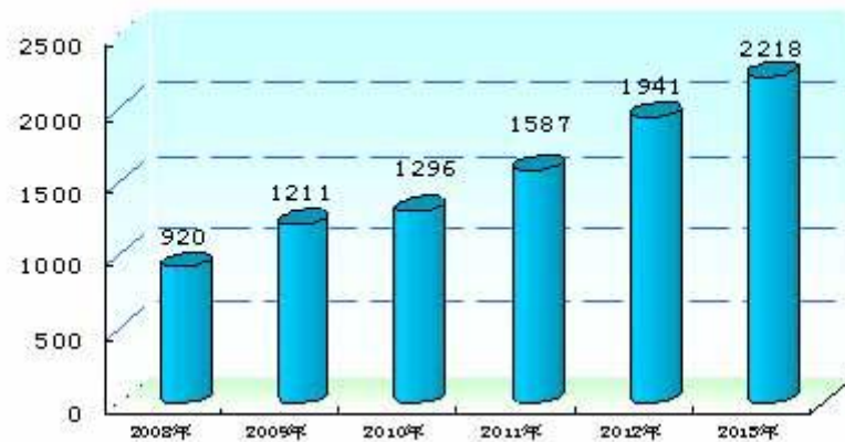
固定资产投资（亿元）

重点领域投资加快。2013 年，全市机电和建材工业行业完成投资 766.6 亿元，比上年增长 30.5%，占工业投资的 55.4%。其中机电工业 675.7 亿元，比上年增长 26.7%；建材工业 90.89 亿元，比上年增长 67.6%。2013 年，全市基础设施完成投资 291 亿元，比上年增长 25.9%，拉动全市投资增长 3.2 个百分点。其中，电力、燃气及水的生产和供应业 125.5 亿元，比上年增长 61.9%；水利、环境和公共设施管理业 123.5 亿元，比上年增长 31.9%；交通运输、仓储和邮政业 98.3 亿元，比上年增长 19.3%。