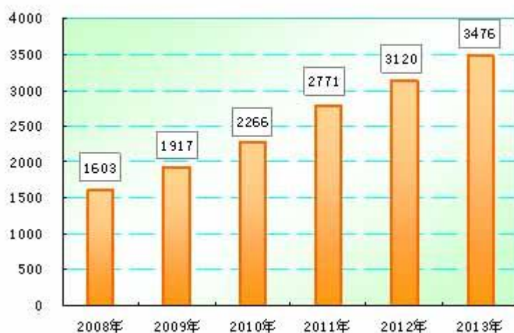
地区生产总值（亿元）

物价水平温和上涨。2013年，市区居民消费价格总指数（CPI）同比上涨2.7%。八大类商品价格“七升一降”。食品类上涨3.2%，衣着类上涨6.0%，家庭设备及维修服务类上涨3.3%，医疗保健和个人用品类上涨0.3%，交通和通信类上涨0.6%，娱乐教育文化用品及服务类上涨2.7%，居住类上涨3.1%，烟酒类下降2.4%。全市工业生产者出厂价格（PPI）同比下跌0.1%，工业生产者购进价格（IPI）同比下跌1.3%。