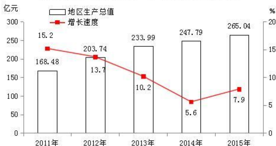
图1:2011年-2015年地区生产总值及其增长速度

经济结构。地区生产总值三次产业结构由上年的15.0:50.6:34.4调整为15.4:49.1:35.5,第一、三产业比重比上年提高0.4和1.1个百分点,第二产业下降1.5个百分点。