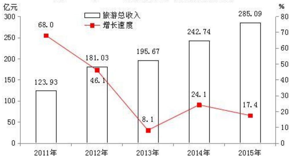
图5:2011年-2015年旅游总收入及其增长速度

11.11 万人次，实现外汇收入 1830.13 万美元，分别下降 25.1%和 42.8%。九黄机场进出港航班 12892 架次，旅客吞吐量 142.15 万人次（其中，进港 71.73 万人次，出港 70.42 万人次），分别下降 18.4%和 16.4%。