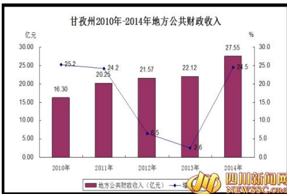
甘孜州 2010 年-2014 年地方公共财政收入

积极培植重点财源，依法加强收入征管，调整优化支出结构，促进财政与经济的良性循环。全州实现地方公共财政收入 27.55 亿元，增长 24.5%。实现税收性收入 18.78 亿元，增长 16.3%。其中，增值税收入 2.65 亿元；营业税收入 9.88 亿元；企业所得税收入 1.76 亿元；个人所得税收入 0.58 亿元。地方公共财政支出 289.50 亿元，增长 5.1%。其中，社会保障和就业支出 23.57 亿元；教育支出 26.16 亿元；一般公共服务支出 27.22 亿元；医疗卫生支出 18.26 亿元；农林水事务支出 39.92 亿元；交通运输支出 78.25 亿元。