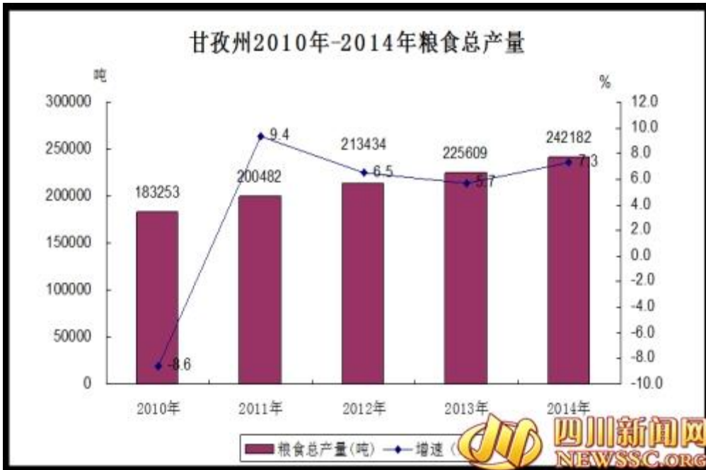
甘孜州 2010 年-2014 年粮食总产量

各类牲畜出栏和畜产品产量稳步发展。全年各类牲畜出栏达 95.18 万头(只)，较上年增加 4.51 万头(只)，增长 5.0%，其中：出栏肉用猪 22.72 万头，较上年增加 0.23 万头，增长 1%，出售和自宰肉用牛 46 万头，较上年增加 2.66 万头，增长 6.1%，出售和自宰肉用羊 26.47 万只，较上年增加 1.61 万只，增长 6.5%；肉类总产量达 63887 吨，较上年增加 2887 吨，增长 4.7%，其中：猪牛羊肉产量达 63648 吨，较上年增加 2867 吨，增长 4.7%；其中：猪肉产量达 13413 吨，增加 143 吨，增长 1.1%；牛肉产量达 46003 吨，增加 2438 吨，增长 5.6%；羊肉产量 4232 吨，增加 286 吨，增长 7.2%。