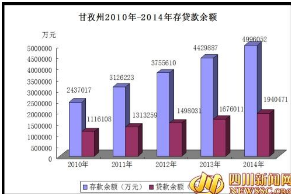
甘孜州 2010 年-2014 年存贷款余额

保险行业保持稳定发展态势。2014 年，全州保险公司保费收入 3.39 亿元，增长 9.2%；保险理赔支出达 1.55 亿元，增长 18.2%。