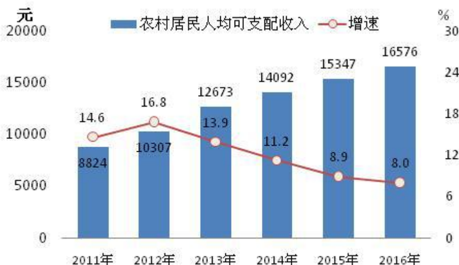
图4：2011—2016年农村居民可支配收入及其增速

全市新增城镇就业 5.2 万人。年末参加城镇基本养老保险职工人数 53.1 万人，其中参保职工 32.9 万人，参保离退休人员 20.2 万人。参加城乡居民基本养老保险人数 116.8 万人。参加城镇职工基本医疗保险人数 47.6 万人，参加城镇居民基本医疗保险人数 51.5 万人，新型农村合作医疗参保人数 187.3 万人，参保率 96.88%。参加失业保险人数 32.2 万，参加工伤保险人数 41 万人，参加生育保险人数 25.4 万人。年末领取失业保险金人数 9100 人。