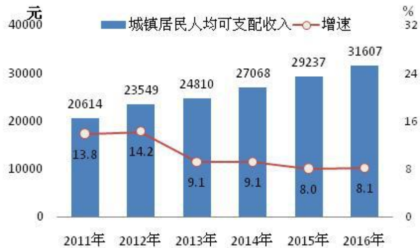
图3: 2011—2016年城镇居民可支配收入及其增速

全市全体居民人均可支配收入 25304 元, 比上年增长 8.5%。其中, 城镇居民人均可支配收入 31607 元, 增长 8.1%; 农村居民人均可支配收入 16576 元, 增长 8.0%。城乡居民收入比为 1.91:1。全市全体居民人均消费支出 18756 元, 增长 9.6%。其中, 城镇居民人均消费支出 22665 元, 增长 9.3%; 农村居民人均消费支出 13343 元, 增长 9.1%。居民食品消费支出占消费总支出的比重 (恩格尔系数) 为 30.9%。