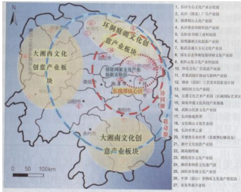
图 2 湖南省文化产业基地空间布局结构示意图