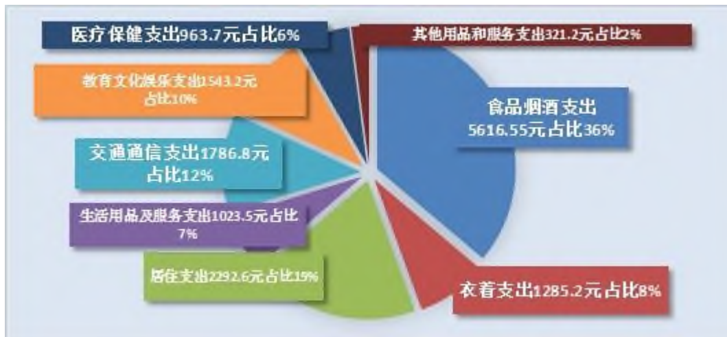
图 3 全区居民人均消费支出结构

全区城镇企业职工基本养老保险参保人数 6.77 万人，比上年增长 15.9%。城乡居民社会养老保险参保人数 20.32 万人，增长 2.3%。城镇职工基本医疗保险参保人数 5.86 万人，增长 10.1%。城乡居民基本医疗保险参保人数 46.01 万人，增长 0.9%。工伤保险参保人数 5.42 万人，增长 7.8%。生育保险参保人数 4.75 万人，增长 12.2%。失业保险参保人数 3.9 万人，增长 10.5%。