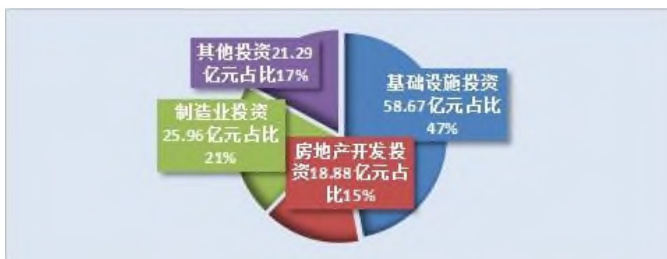
图 2 2018 年按领域分固定资产投资及其占比

全年商品房施工面积 222.92 万平方米,比上年增长 1.2%。商品房销售面积 58.54 万平方米,增长 3.4%,其中,住宅销售面积 52.50 万平方米,增长 10.1%。商品房销售额 29.25 亿元,下降 3.7%,其中,住宅销售额 26.80 亿元,增长 20%。