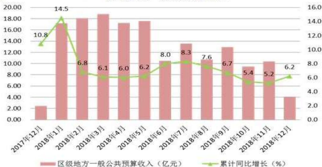
图2 2018年区级地方一般公共预算收入

全区实现区级地方一般公共预算支出 301.61 亿元，同比增长 11.0%。一季度累计增幅最高，为 19.1%，12 月份单月绝对量最高，为 58.24 亿元。其中区本级支出 222.43 亿元，同比增长 17.6%，镇级支出 79.18 亿元，同比下降 4.2%。