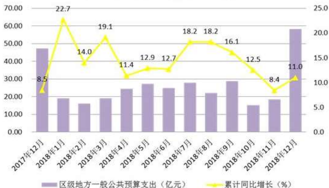
图3 2018年区级地方一般公共预算支出

全年实现固定资产投资总额 496.08 亿元，同比增长 17.5%。其中第二产业实现固定资产投资总额 73.09 亿元，同比增长 7.0%，第三产业实现固定资产投资总额 422.99 亿元，同比增长 19.5%。固定资产投资构成中，工业投资比重为 14.7%，服务业比重为 4.9%，房地产投资比重最大，为 72.3%，其中商业营业房投资和办公楼投资占总投资的比重分别为 4.9%和 3.9%。