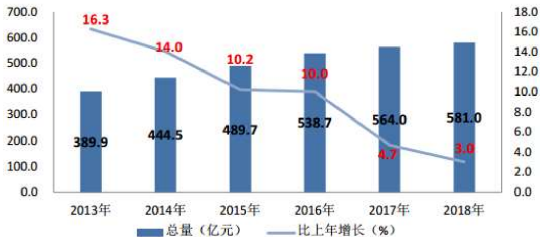
图 3：2013—2018 年社会消费品零售总额及增长速度

会展业——全年累计举办展览 45 个，展出面积 556.5 万平方米，展出接待 676.1 万人次，展出面积和接待人次分别增长 18.3% 和 34.8%。首届中国国际进口博览会顺利闭幕，青浦举全区之力胜利完成服务保障工作，同时抢抓展会溢出效应，加快建设运营“1+4”平台，1 即与国家会展中心合作建立海外贸易组织办公平台，4 个常年展示交易平台包括东浩兰生“一带一路”进口商品展销中心、绿地全球商品贸易港、西郊国际农产品交易中心、青浦跨境电商保税展示贸易物流中心。