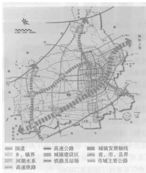
图 3 某县级市市域城镇体系规划图