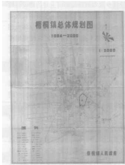
图 2 某县级市城关镇总体规划图