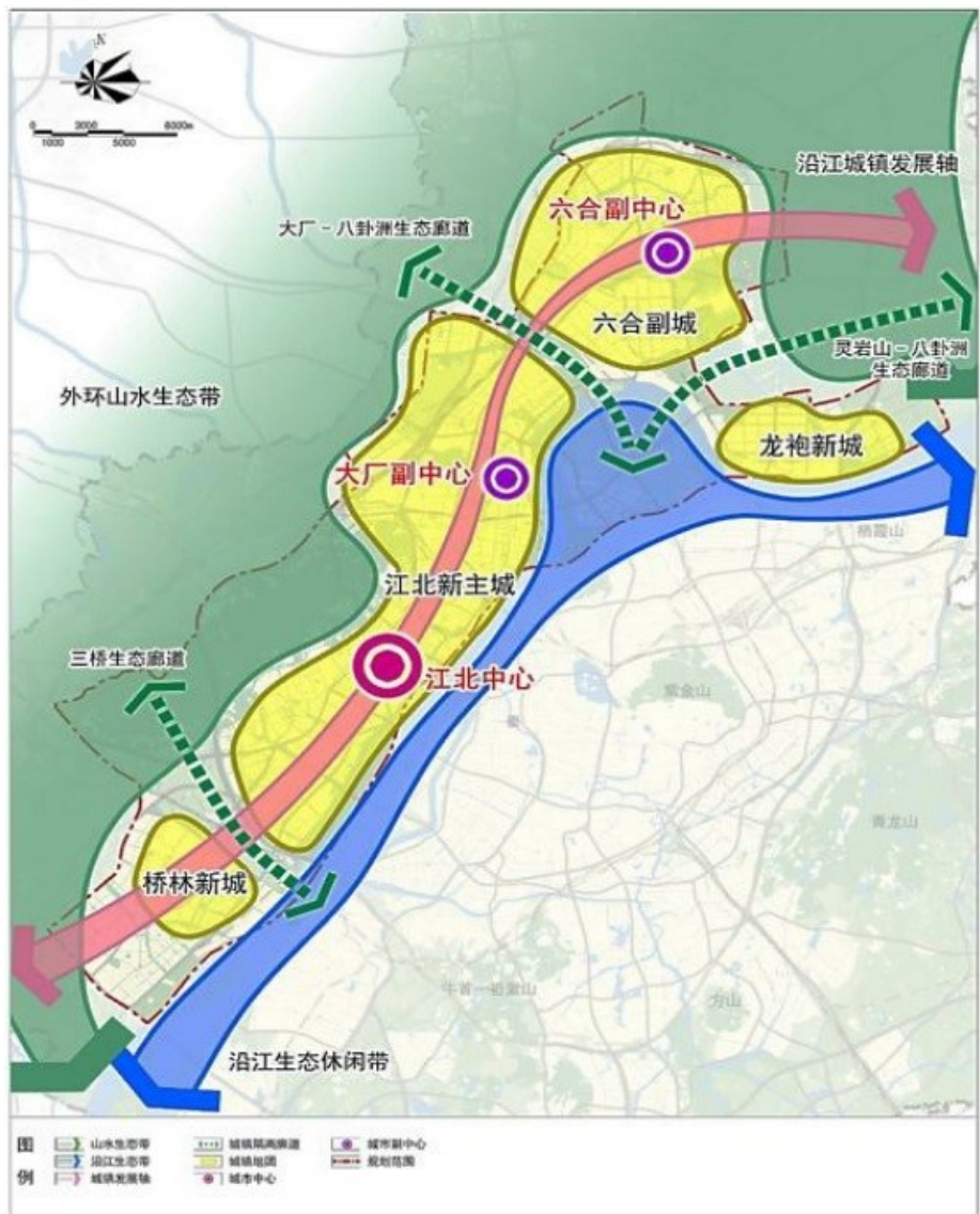
新区空间结构规划示意图

团”的空间结构。优化城市发展格局，全面推进“中部崛起，北进南拓”。中部以中央商务区为主体，加快建成扬子江国际会议中心等地标建筑，打造体现新区国际化形象的集中展示区和总部经济核心承载区。北部以新材料科技园、智能制造产业园、生物医药谷为支撑，加快南京北站、西坝港等重大枢纽工程建设，成为新区辐射苏皖的产业高地和区域合作示范区。南部以产业技术研创园为主体，抓住五桥开通契机，强化全域联动创新，打造开放程度高、创新能力强的经济发展新引擎。