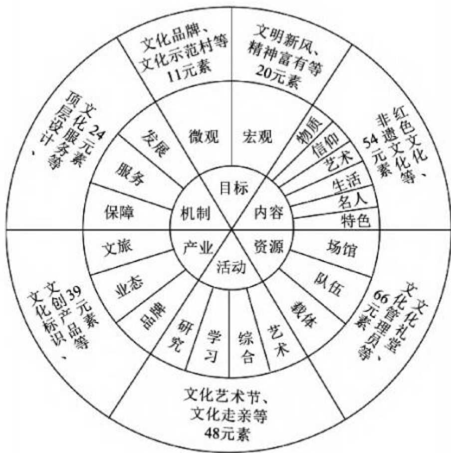
图 1 乡村文化建设环形结构模型

第二，乡村文化建设导向明确。文化底层结构要素表明，乡村文化建设表现出三个导向：一是政治方向明确，强调新时代中国特色社会主义文化高地、精神富有、精神文明、爱国主义、道德垂范等反映时代特征与需求的重要内容；二是注重赋能乡村振兴，强调以文兴业、以文化人、文化惠民，树立乡村文明新风、家庭新风成为乡村文化建设的普遍追求；三是重视文化内涵建设，乡村文化内容建设逐步引起重视，高质量发展成为人们关注的焦点。